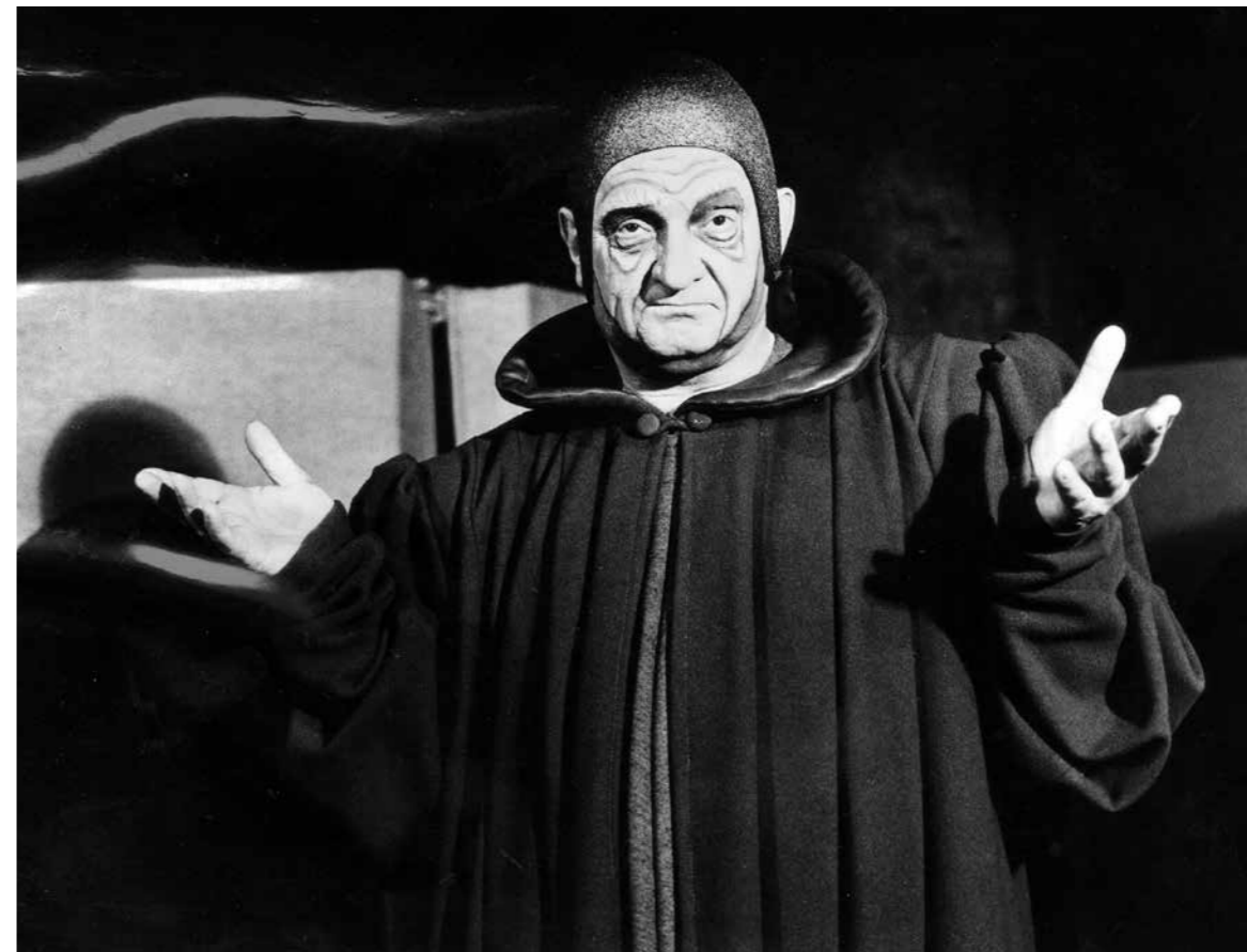
LANKASTERIO HERCOGAS DŽONAS GANTAS – A. Masiulis. W. Shakespeare'o „Ričardas II“, rež. J. Vaitkus. 1985